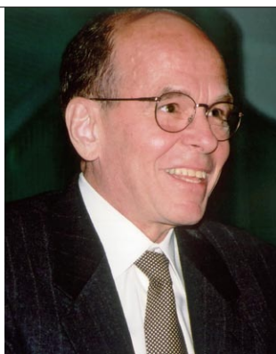
K. BARRY SHARPLESS, PhD W. M. Keck Professor of Chemistry The Scripps Research Institute (TSRI) Beckman Center for Chemical Sciences Nobel Prize in Chemistry, 2001.